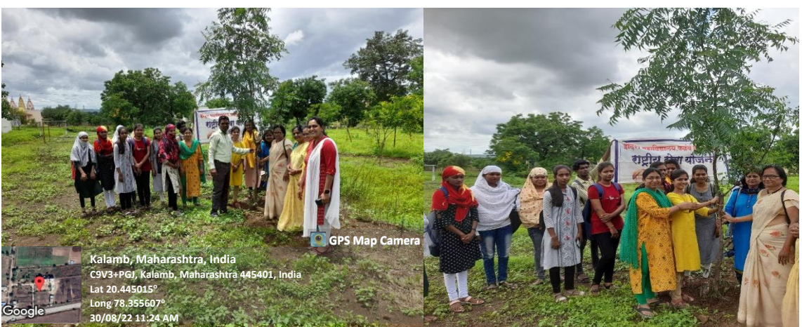
Tree Preservation through Rakshabandhan Program